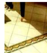
Carrelages et faïences